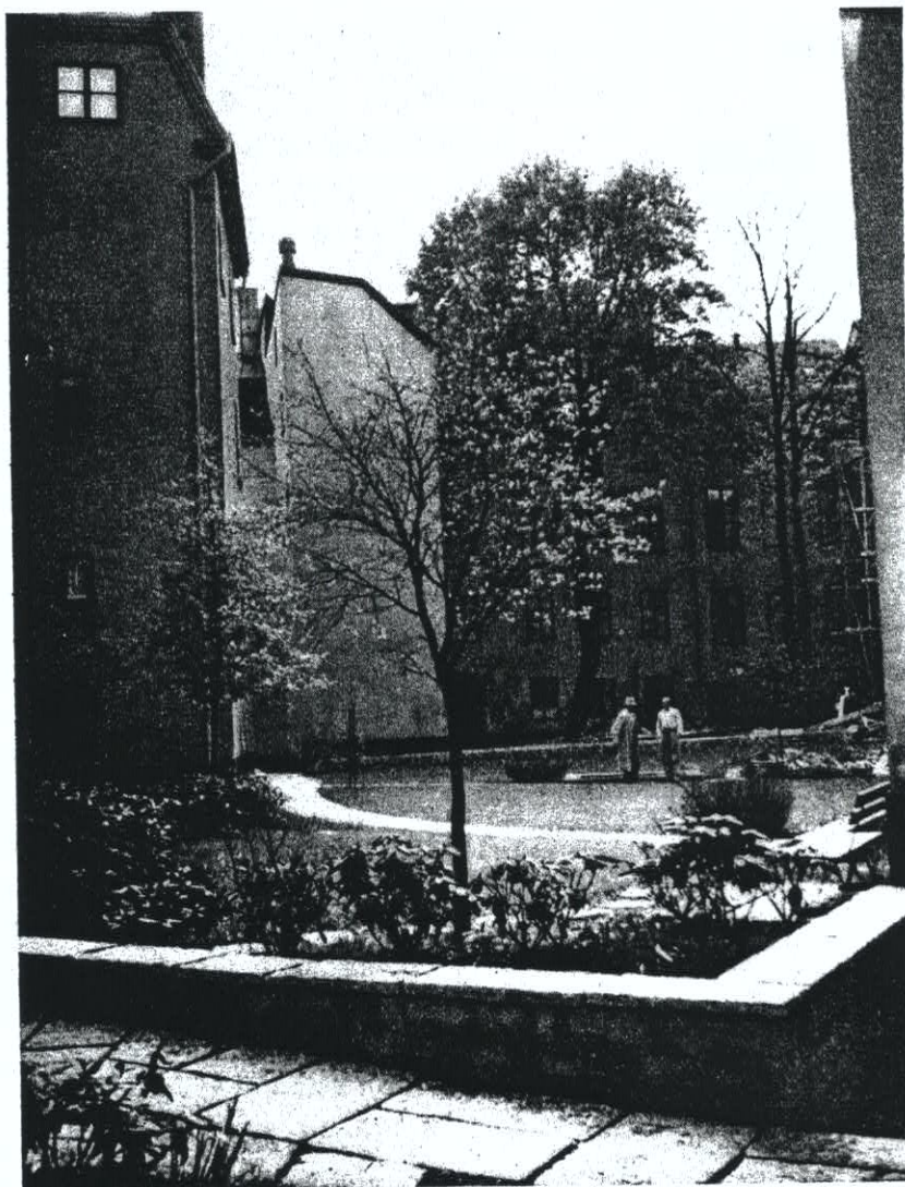
Lyckligtvis funnos två stora gamla träd på en av gårdarna. De ha kompletterats med några få nya träd.

Trädgårdsanläggning i kv. Cepheus i Staden mellan broarna av Sven A. Hermelin och Inger Wedborn.