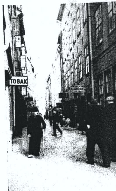
Den trånga Köpmangatan i Staden med broarna.